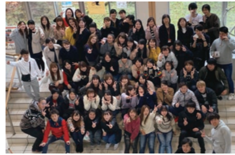
親睦会後の集合写真(現3学年)

看護学部では1年に一度、学生とアドバイザー教員と一緒に楽しむ親睦会を実施しています。親睦会は学生が主体となって計画・実施します。学年によって、親睦会のテーマや内容が変わるので、教員もとても楽しみにしています。今年入学をした1年生は夏の親睦会を予定しています。