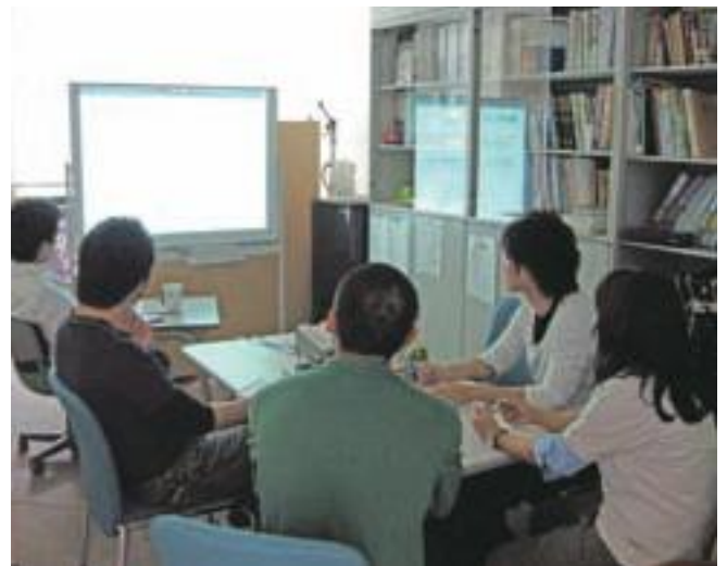
毎週行っているゼミの研究報告会