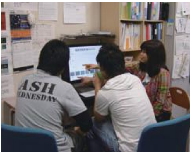
カウントした細胞数をコンピューターに入力して、細胞増殖曲線のグラフを作成(順調に増えていたか検討中)