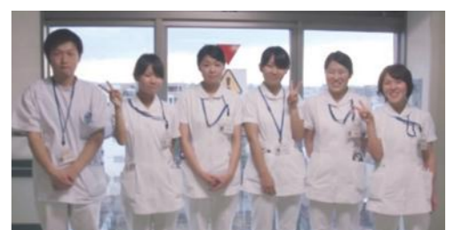
撮影協力:3年生(5期生)の実習6グループ