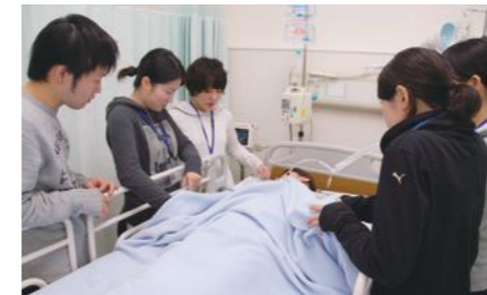
「ICUに入室している患者様ってどんな感じだろう。」 「どんなケアをしたいのかなあ。」

急性期看護学実習では2週目の水曜日に、学内で実習室に設定されたICUに近い環境で患者、家族、看護師役を設定し、演習を行っています。演習後には、この体験をもとにディスカッションを行い、ICU入院中の患者様とご家族に対する援助について学びを深めています。