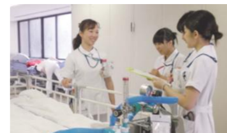
足りないものがないか、しっかり点検!