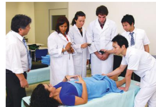
日本の鍼灸について、本学教員からのレクチャー

「私は幼少期から、日本の武道や、少林寺拳法、アニメなどの文化に触れて、日本に対して憧れを持っていました。一方、他人に貢献できる医療という仕事は、素晴らしいと考えています。ですから今回、日本で医療を学ぶことに大変感激しています。また、明治国際医療大学は、施設が整い、環境がすばらしかったです。このような大学で学べたことを大変嬉しく思っています。今回の滞在では、殆ど全てのことが印象的でした。ポルトガルとは全く異なる素晴らしい環境で学べましたし、日本の人たちの親しみ深い歓迎の中で、トレーニングに集中することができたことは素晴らしいことと思っています。」