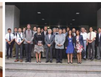
協力スタッフとの集合写真