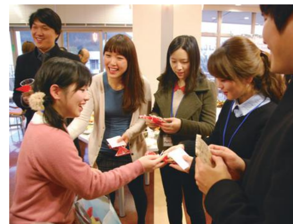
お別れパーティー