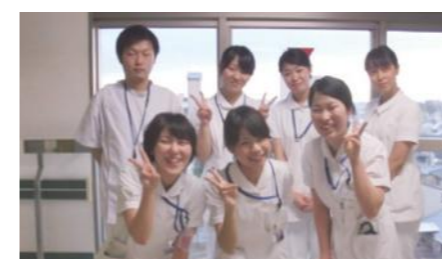
病院の踊り場にて