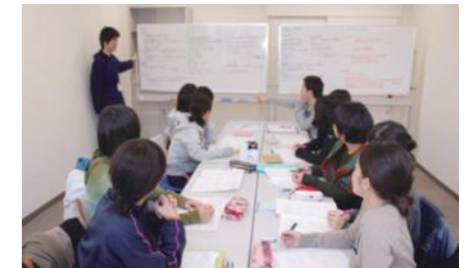
演習で気づいたことを真剣ディスカッション!