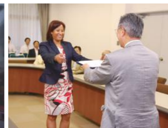
学長より短期研修修了証の授与