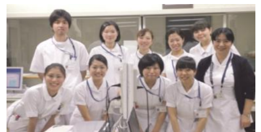
ナースステーションにて、指導者さんと先輩と一緒に撮影協力:3年生(5期生)の実習5グループ