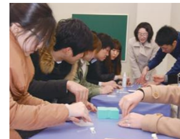
日本の鍼灸を体験

また2月4日～15日まで、韓国の漢陽大学(Hanyang University)から5名の医学生が研修に来られ、鍼灸学部の学生達と交流しました。今回の交流は、京都新聞の企画「@キャンパス」で取り上げられており、学生達が紙面を作製します。記事は5月1日の夕刊に掲載される予定です。