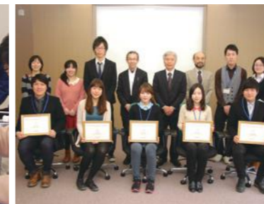
短期研修修了書を授与