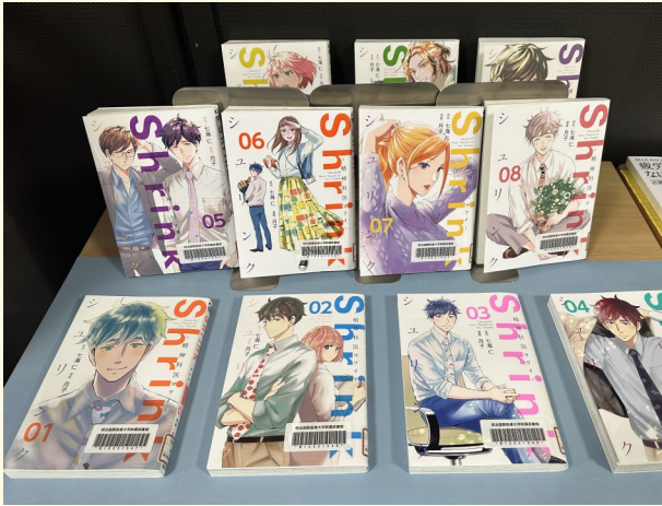
Shrink : 精神科医ヨワイ シリーズ

明治国際医療大学附属図書館が、4月に受け入れた図書のリストです。ご希望の図書が書架にない場合には、予約申込をご利用ください。ご不明な点がございましたら、お気軽に職員にお尋ねください。